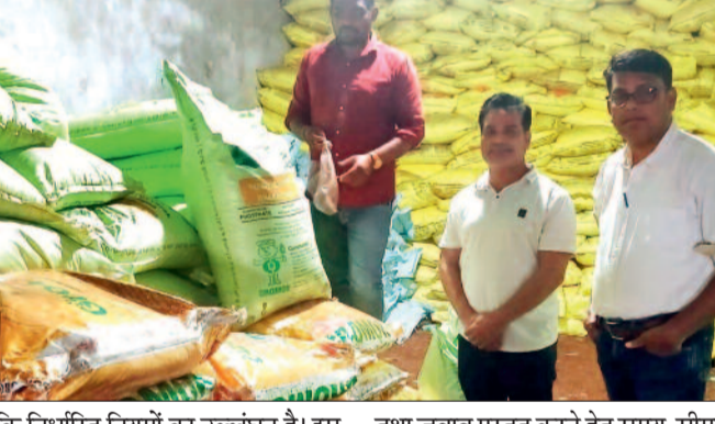
कि निर्धारित नियमों का उल्लंघन है। इस पर संबंधित विक्रेताओं को तत्काल कारण बताओ नोटिस जारी किया गया है