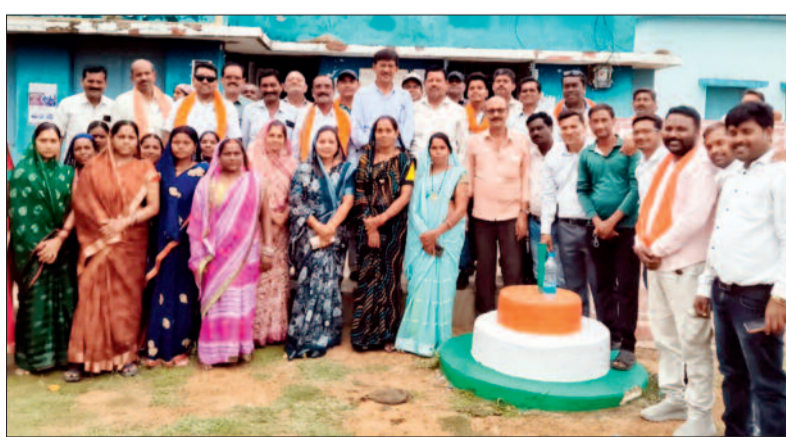
पीएम नरेंद्र मोदी के नेतृत्व में पहलगांव हमले के जवाब में ऑपरेशन सिंदूर चलाकर महिलाओं का